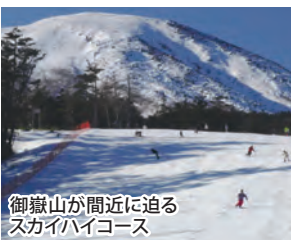
御嶽山が間近に迫るスカイハイコース

平日はリフト1日券がおとな2000円、中学生以下1200円と、よりリーズナブルな価格でご利用いただけます。