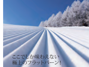
ここでしか味わえない 極上のフラットバーン！