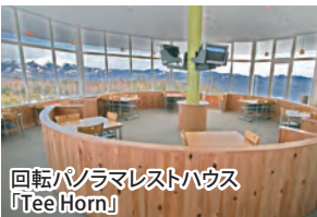
回転パノラマレストハウス「Tee Horn」

■開田高原マイアスキー場 営業期間予定: 2018年12月8日(土)~ 2019年4月7日(日) ☎0264-44-1111 ホームページ http://www.mia-ski.com