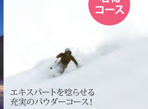
エキスパートを唸らせる 充実のパウダーコース！