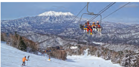
美しい木曾御嶽山 (シークレットAコース)