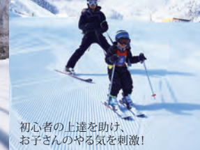
初心者の上達を助け、 お子さんのやる気を刺激！