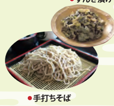
● すんぎ漬け ● 手打ちそば