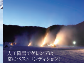
人工降雪でゲレンデは 常にベストコンディション！