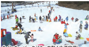
ウインキーパーク(50mの動く歩道完備)

小中学生の1日券が1000円、未就学児無料の家族ふれあいの日です。週末はゆるキャラ、ウインキーに会えるかも!